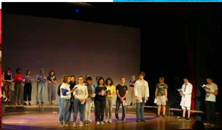
Restitution du Comité de lecture, écriture en-jeux