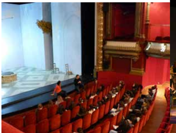
Bord de scène avec l'équipe artistique du spectacle George Dandin