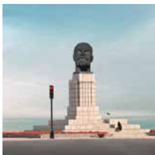
Spectacle en russe surtitré en français