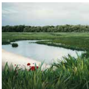
Spectacle en roumain surtitré en français