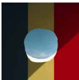
Spectacle en anglais, roumain, français, tchèque surtitré en français